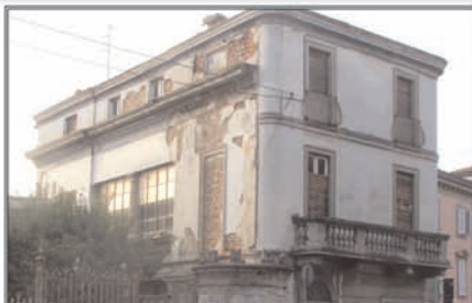
VILLA ABBANDONATA PIAZZA DEL POPOLO