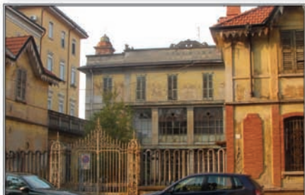
VILLA IDA - VIALE DEL PARTIGIANO