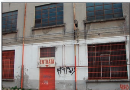
EX COMPRABENE - VIA BATTISTI