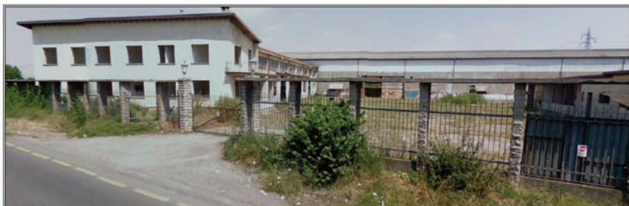
FABBRICA ABBANDONATA - VIA BERGAMO