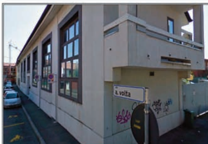
UFFICI ABBANDONATI - VIA TORTA